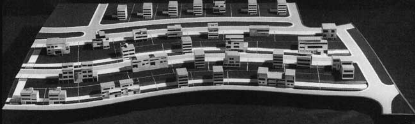
Propagační model Osady Baba z ledna 1930, autor J. Kuba

akci zaštitila. Stavebníkem byli členové Svazu, kteří si nechali vypracovat projekt od jiného člena – architekta. Nezbytným předpokladem úspěšnosti celé výstavy byla jinak dosti vzácná souhra architekta a stavebníka. Přesto celá řada kompromisů musela nutně vzniknout. Nebyly ale nikdy takového rázu, aby zcela narušily estetickou celistvost, která i dnes, s odstupem více než sedmdesát let, i po mnoha nevhodných a brutálních zásazích, udivuje.