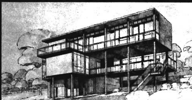
Mart Stam, slavná perspektivní kresba zahradního průčelí Paličkovy vily, 1932